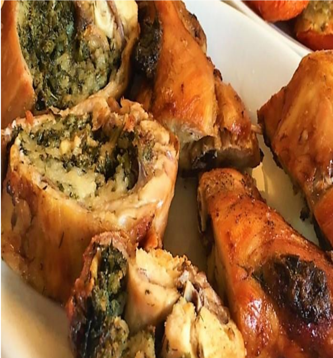
CONIGLIO IN PORCHETTA