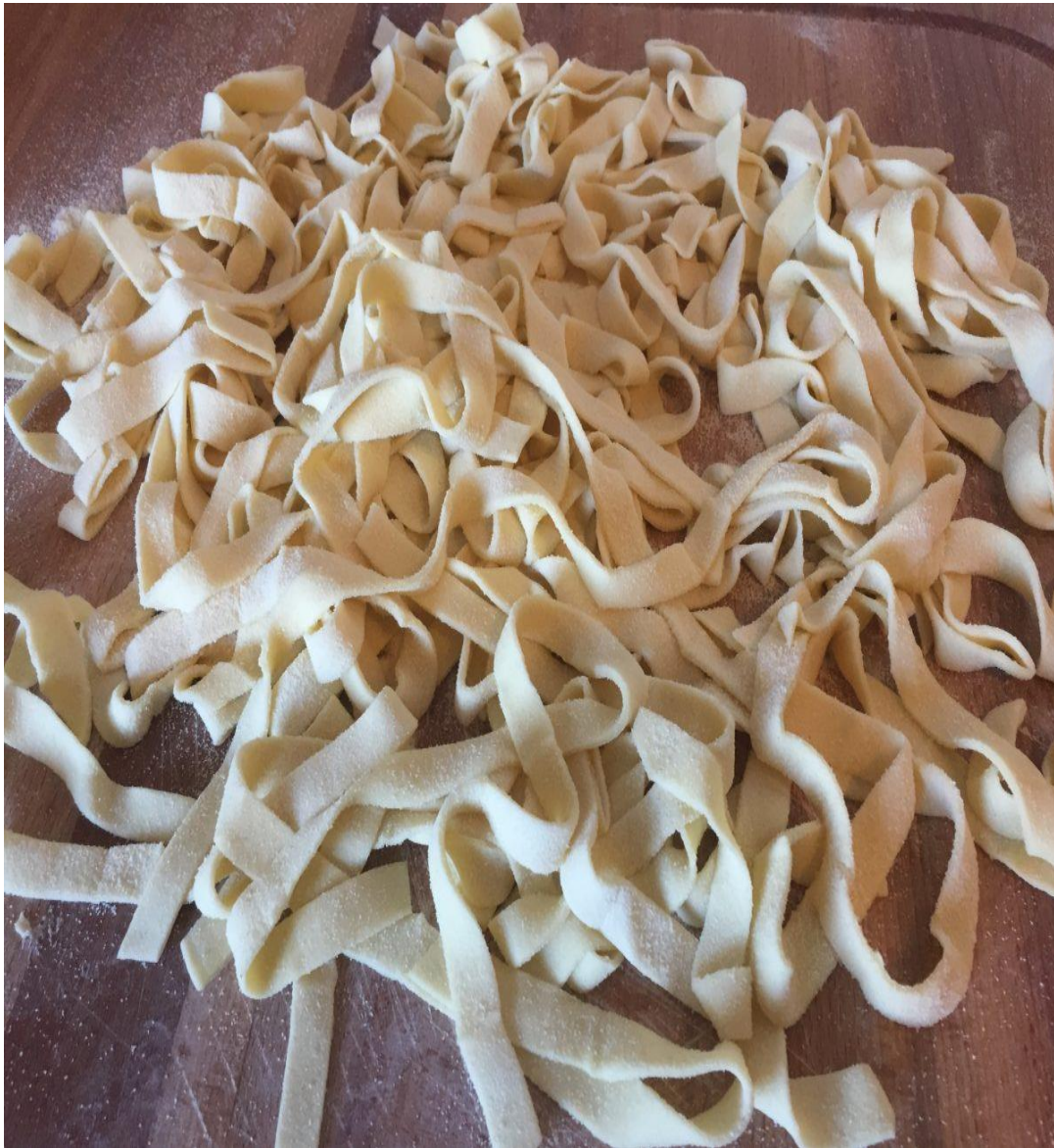
PENCIARELLE AL SUGO DI BACCALA' E POMODORO