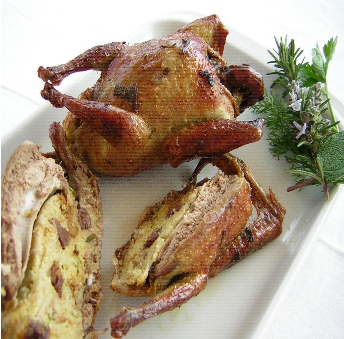
PICCIONI RIPIENI ARROSTO MORTO