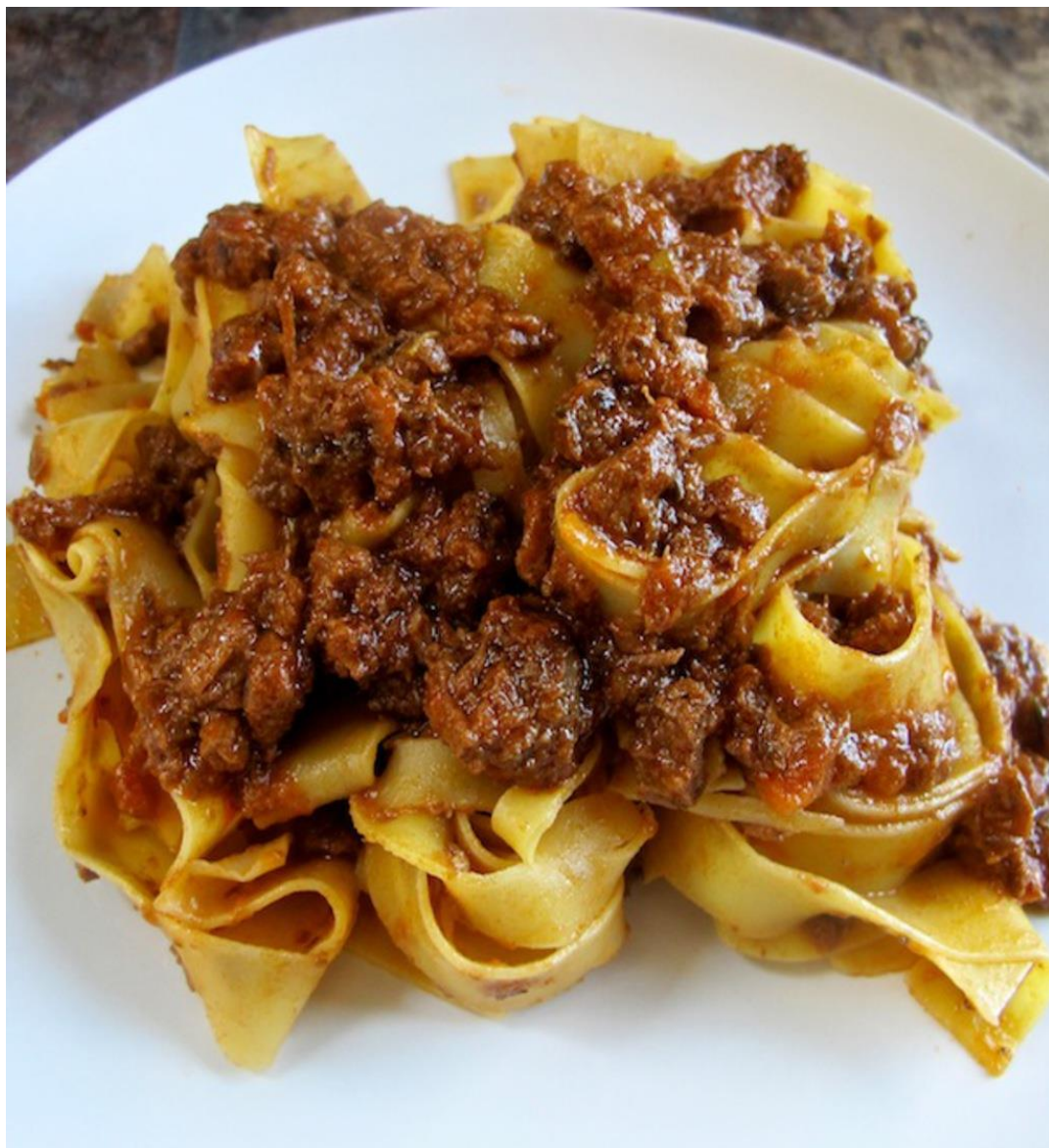
PAPPARDELLE AL SUGO DI CINGHIALE