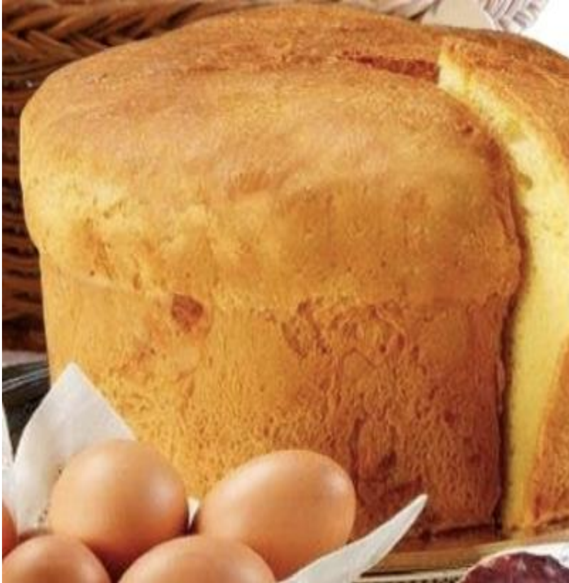
PIZZA PASQUALE DI FORMAGGIO